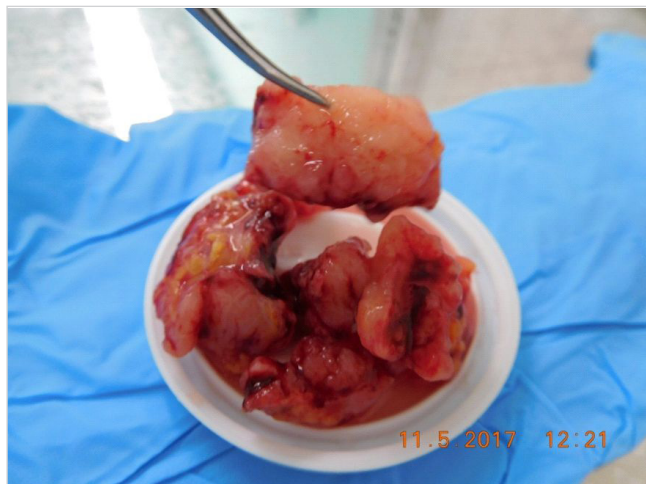
Obr. č. 7: Nádorové masy odstránené počas zákroku, na reze belavé, droľivé, neopúzdrené