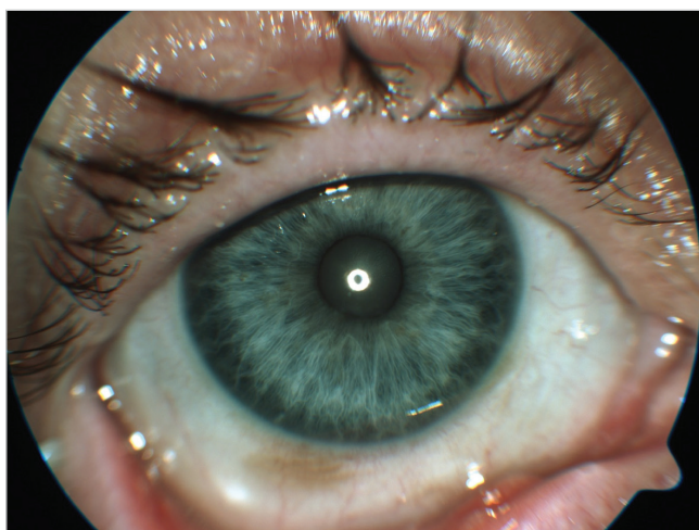
Obr. 3 Nález 3 týdny po zahájení substituce vitamínu A per os

oku byla 1,5 metru, na levém oku sporně bez světlocitu. Na pravém oku byl typický nález xeroftalmie včetně Bitotových skvrn (obr. 1), keratinizace a těžkého syndromu suchého