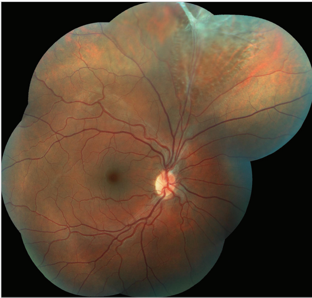
Obr. 1 Barevný fotografický snímek fundu pravého oka: sítnice je v horních kvadrantech prořídla, při horní temporální arkádě jsou pozůstatky perzistující arteria hyaloidea s fibrotickou tkání způsobující lokální retinoschízu staršího data

viště ke zvážení dalšího postupu. Obě pacientky si dlouhodobě stěžovaly na postupně se zhoršující vidění a pocity tlaku v očích. Vyšetření očního pozadí v mydriáze odhalilo preretinální fibrózu způsobující v jednom případě lokální trakční odchlípení sítnice (TOS) a ve druhém případě lokální retinoschízu.