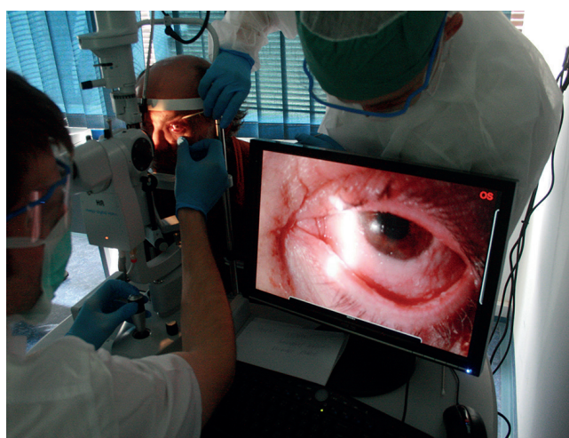
Obr. 4 Vyšetření na štěrbinové lampě po opětovném manuálním vybavení larev

gem a zdravotním ústavem v Ostravě nasazujeme zatím pouze lokální antibiotickou terapii Ophthalmo-Framykoin ung.