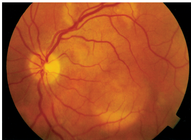
Obr. 1 b Makulárne a extramakulárne viteliformné ložiská. Ľavé oko r. 1996