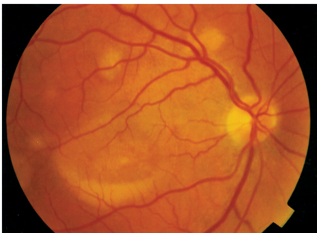
Obr. 1 a Makulárne a extramakulárne viteliformné ložiská. Pravé oko r. 1996