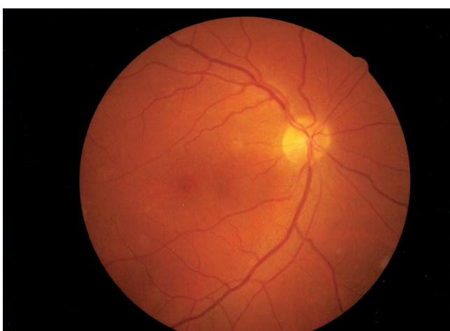
Obr. 3 a Pravé oko r. 2014