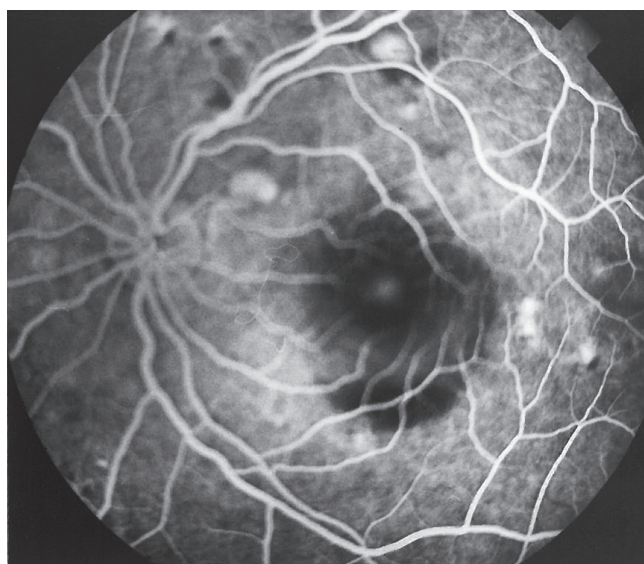
Obr. 2 b FAG. Ľavé oko r. 1996