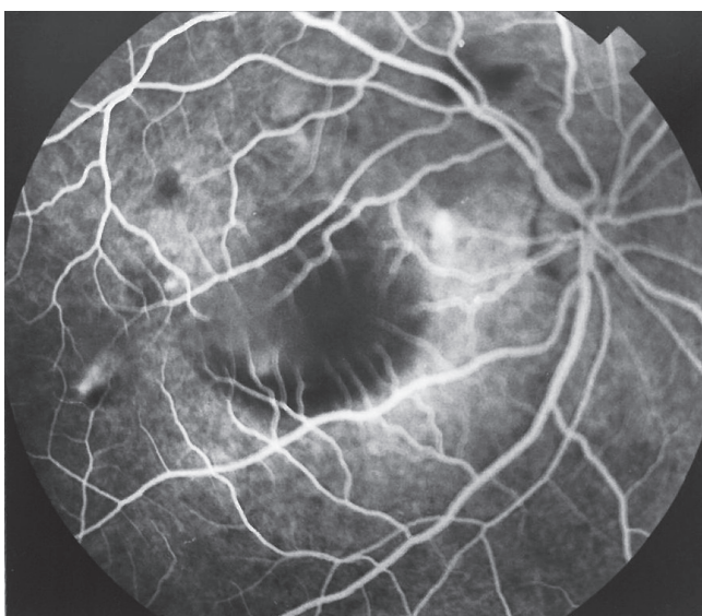
Obr. 2 a FAG. Pravé oko r. 1996