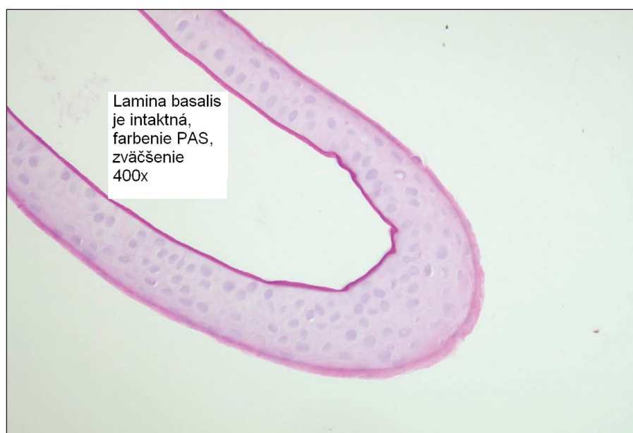
Obr. 3. Epiteliálny flap vytvorený iba mechanicky, lamina basalis je prítomná

nalý flap s jemnými iregularitami pozdĺž okrajov, 3 celý intaktný flap s trhlinami len na jeho okrajoch, 2 nepravidelný alebo voľný flap, 1 nekompletný, defektný flap.