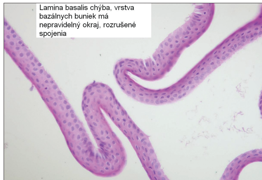
Obr. 2. Epitelialný flap vytvorený s pomocou alkoholu, lamina basalis nie je prítomná