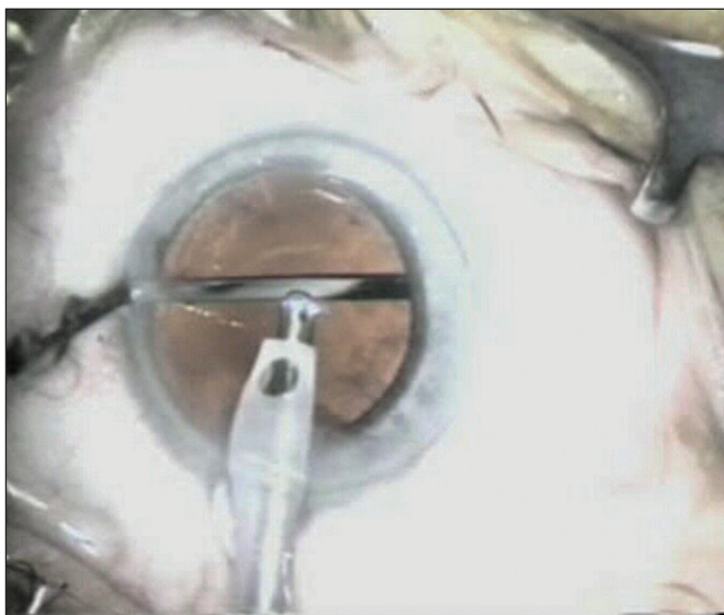
Obr. 2. LIDRS – separace předního pouzdra a duhovky