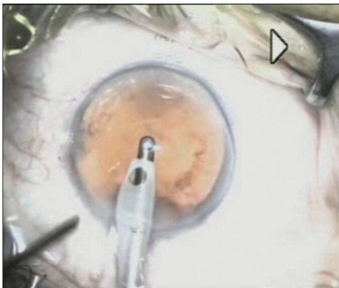
Obr. 1. LIDRS