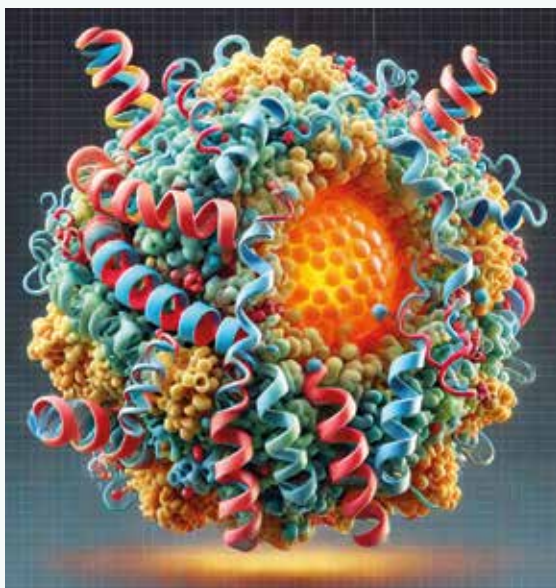
Obr | Molekula lipoproteínu(a)

Lp(a) sa správa ako aterogénny lipoprotein, ktorý podporuje tvorbu aterosklerotických plakov v stenách ciev. Obsahuje cholesterolové estery a oxidované fosfolipidy, ktoré sa hromadia v endotelových bunkách a podporujú zápal a poškodenie cievného endotelu. Tieto pláty narúšajú normálny