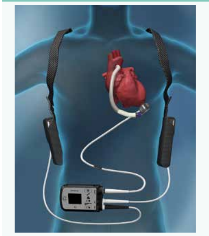
Obr | Mechanická srdeční podpora HeartMate 3 (použito se svolením společnosti Abbott U.S.)